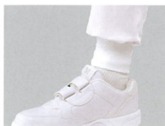
●裾口フリス仕様 AP 402 AP 403

男女兼用 異物混入防止 防透性 吸汗性 制電性 通気性 速乾性 伸縮性 低発塵性