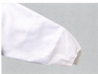
●袖口体毛落下防止加工袖 AP 401