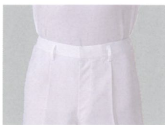
●フロントワンタック AP 402 AP 403