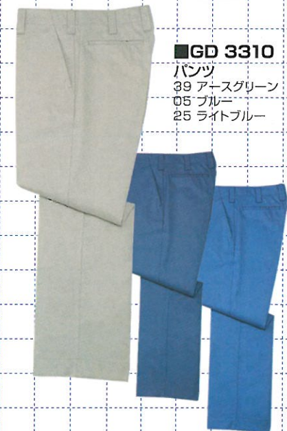
■GD 3310 パンツ 39 アースグリーン 05 ブルー 25 ライトブルー