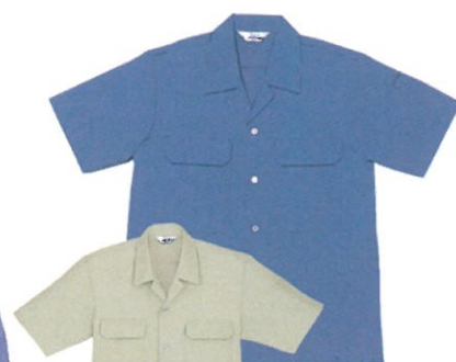
■GD 6056 半袖シャツ 005 ブルー 025 ライトブルー 39 アースグリーン