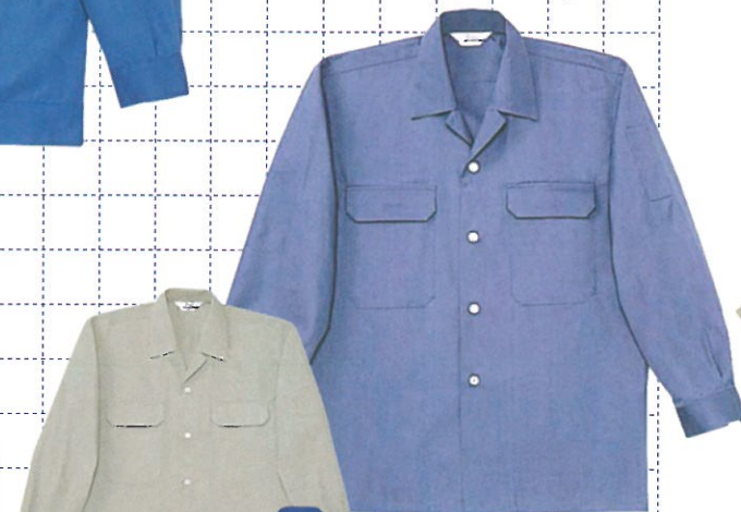
■GD 6055 長袖シャツ 05 ブルー 039 アースグリーン 025 ライトブルー