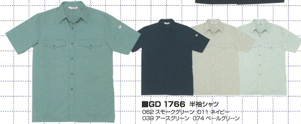
■GD 1766 半袖シャツ

074 ペールグリーン 062 スモークグリーン 039 アースグリーン 011 ネイビー