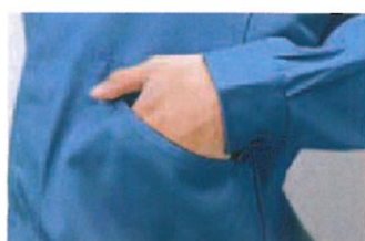
●脇ポケット GD 3300

現場での作業効率をアップする、動きやすさを実現!腕がつっぱらないノーフォーク仕様。