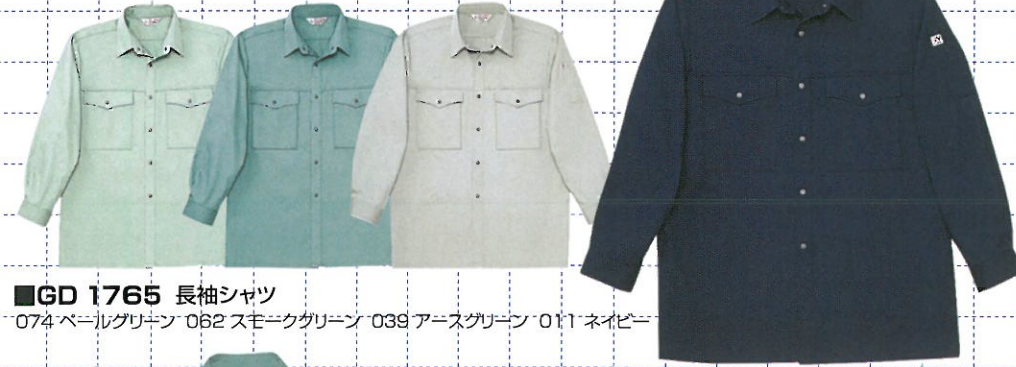
■GD 1765 長袖シャツ

074 ペールグリーン 011 ネイビー 039 アースグリーン 062 スモークグリーン