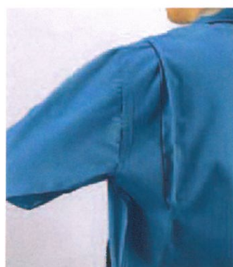
●ノーフォーク GD 3300

現場での作業効率をアップする、動きやすさを実現!腕がつっぱらないノーフォーク仕様。