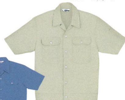
■GD 6057 ブルゾン(半袖) 25 ライトブルー 39 アースグリーン