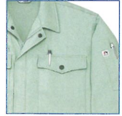
ベン差し GD 6700

062 スモークグリーン 011 ネイビー 039 アースグリーン 074 ペールグリーン