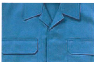
●前立て比翼仕様 GD 3300