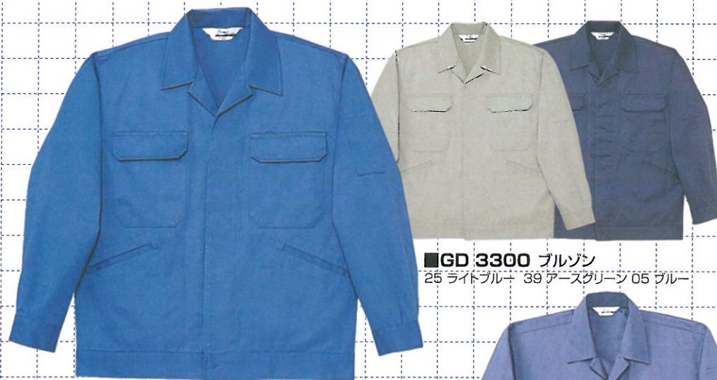
■GD 3300 ブルゾン 25 ライトブルー 39 アースグリーン 05 ブルー