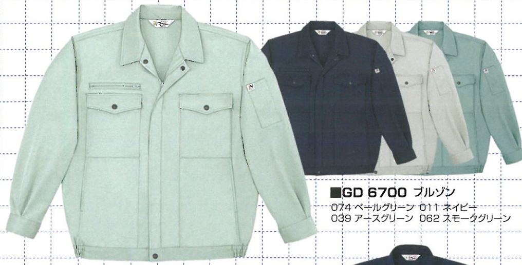
■GD 6700 ブルゾン

074 ペールグリーン 011 ネイビー 039 アースグリーン 062 スモークグリーン